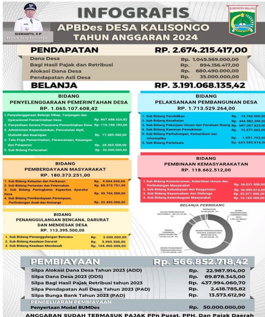
Gambar 4. Banner APBDes Desa Kalisongo