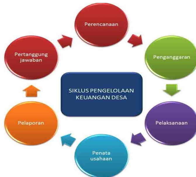
Gambar 3. Tahapan Pelaporan Keuangan Desa Melalui Siskeudes

Dalam Peraturan Menteri Dalam Negeri (Permendagri) No 20 tahun 2018 tentang pengelolaan keuangan terdiri dari beberapa tahap yaitu perencanaan, penganggaran, penatausahaan, pelaporan, dan pertanggungjawaban. Berikut adalah penjelasan mengenai alur atau tahapan dalam penggunaan Siskeudes: