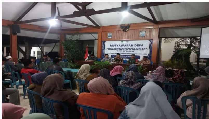
Gambar 1. Musyawarah Desa

Relevan yaitu informasi harus relevan untuk memenuhi kebutuhan pemakai dalam proses pengambilan keputusan serta dapat membantu manajer dalam penyajian data yang penting dan berguna bagi pemangku kepentingan.