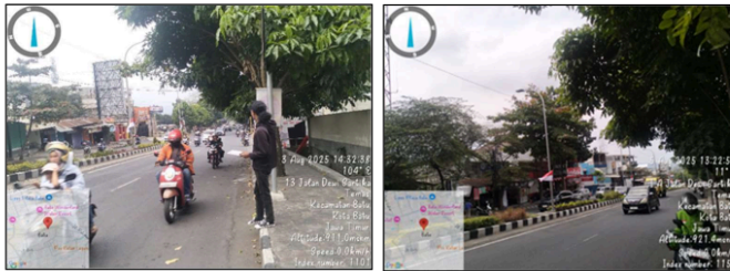
Gambar 2. Volume Lalu Lintas, Jalan Dewi Sartika

Berdasarkan PKJI 2023, kendaraan pada jalan perkotaan dibagi menjadi tiga kategori utama, yaitu SM, KR, dan KS. Sementara itu, kendaraan tidak bermotor (KTB) tidak dimasukkan dalam perhitungan arus lalu lintas, karena dianggap sebagai hambatan samping yang pengaruhnya diperhitungkan melalui faktor koreksi kapasitas akibat hambatan samping (FCHS).