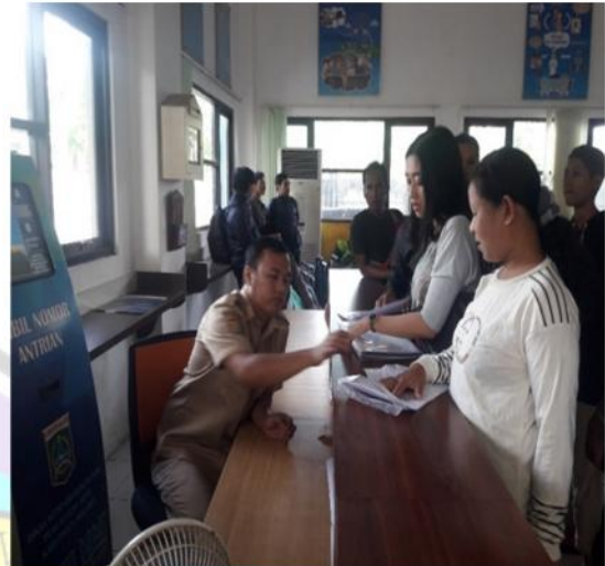
Gambar Pelayanan Akurasi/baik Dispenduk Capil Kabupaten Malang