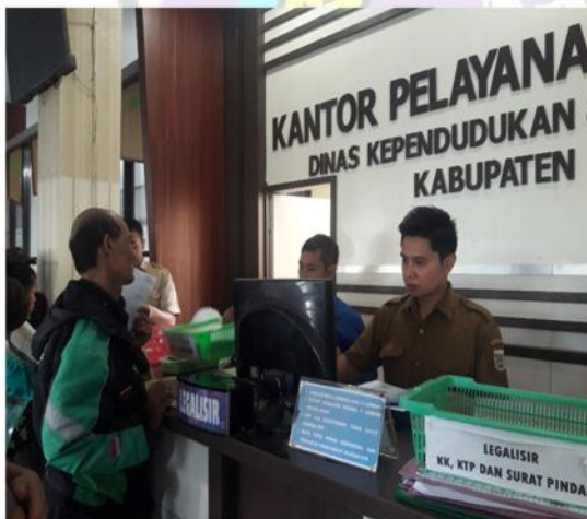
Gambar Pelayanan yang ramah Dispenduk Capil Kabupaten Malang